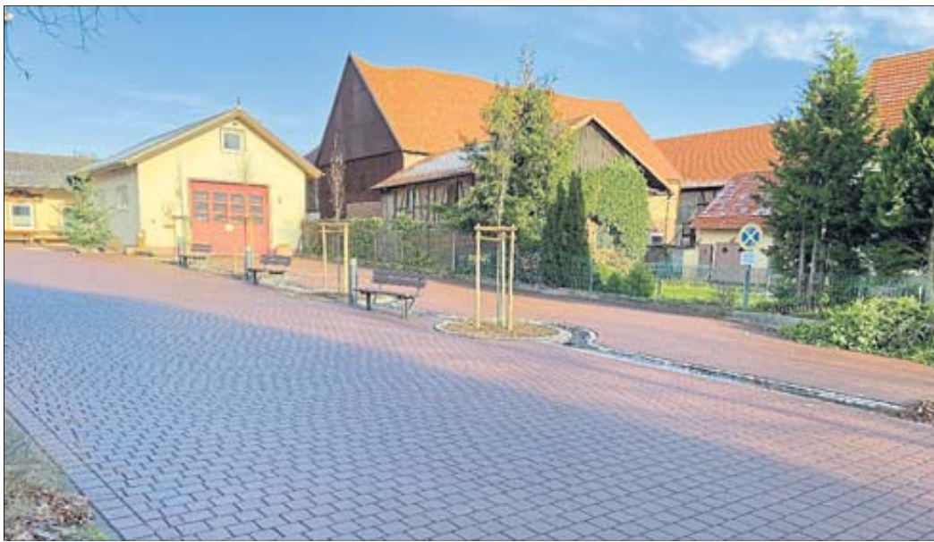
Außenanlage am Dorfgemeinschaftshaus in Rimmbach nach abgeschlossener Neugestaltung.

Weitere Informationen zur Dorfentwicklung unter www.schlitz.de/aktuelles/dorfentwicklung-ikek . Stadt Schlitz