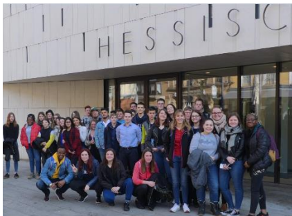
Jugendliche Parlamentarier zu Besuch im Landtag

Ein Wahlkreuz, hier ohne Stimmzettel